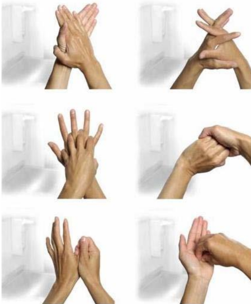
AFBEELDING 4.2 Techniek om alle onderdelen van de handen te bereiken bij handdesinfectie en handen wassen.